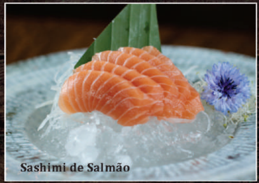
Sashimi de Salmão