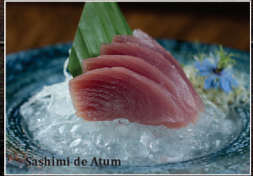
Sashimi de Atum