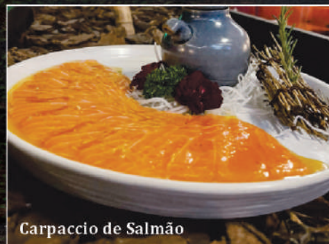
Carpaccio de Salmão