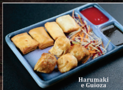
Harumaki e Guioza