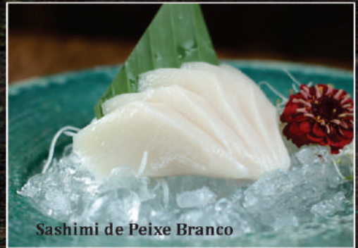
Sashimi de Peixe Branco